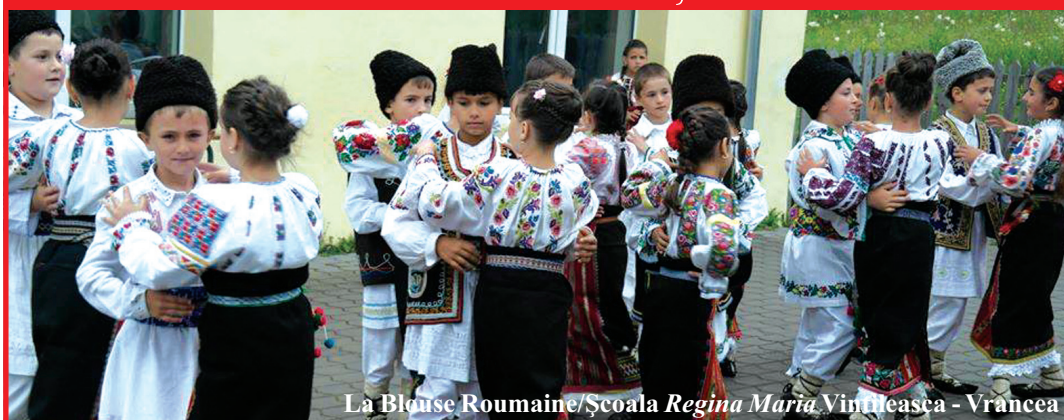
La Blouse Roumaine/Școala Regina Maria Vințuțea - Vrancea

În ziua de 24 iunie, românii de pretutindeni sunt invitați să poarte ie, să îmbrace Pământul în ie românească. Ziua Universală a Iei, eveniment aflat acum la cea de-a doua ediție, inițiat și coordonat de comunitatea online La Blouse Roumaine , este un prilej pentru noi toți de a promova frumusețea iei și de a crea un brand de țară recunoscut de toată planeta.